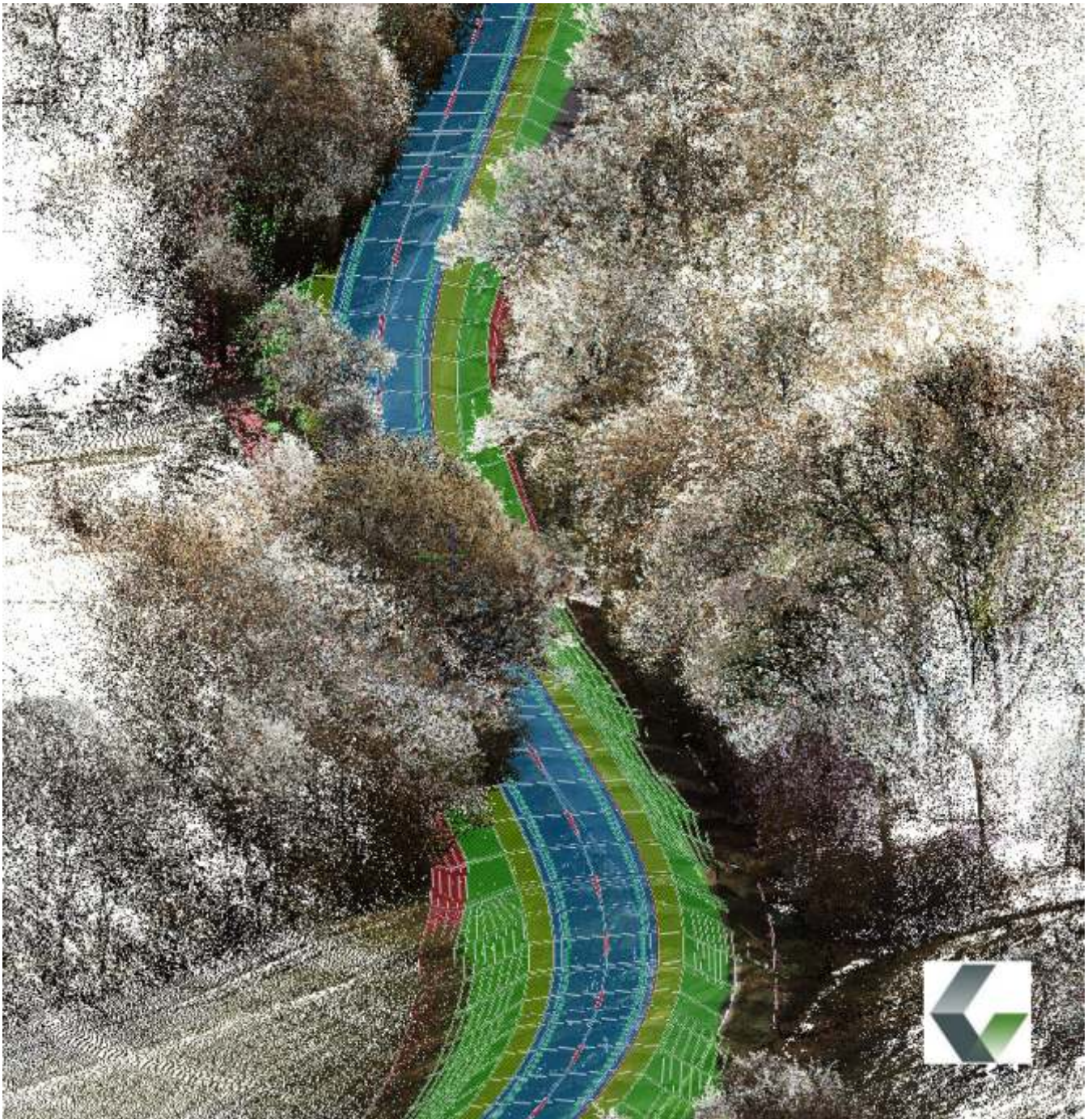
Umplanung einer Landstraße